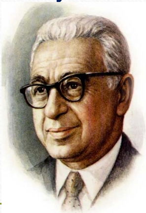
Матвей Блантер (композитор)