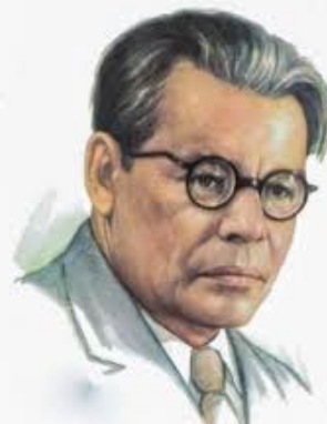
Михаил Исаковский. (автор слов)